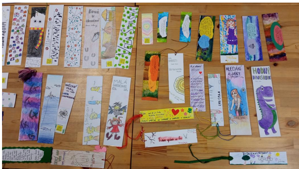
Mateřská a Základní škola při FN Brno

(Mateřská a Základní škola při FN Brno, Jana Čalkovská)